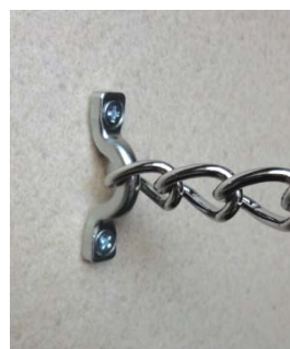
IPF50とIM132の使用イメージ